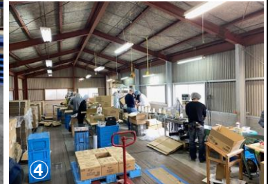
①②③鉄工部品の組み立て・梱包作業 ④日用雑貨品の箱組み立て・中身入れ・ロット印字・梱包作業